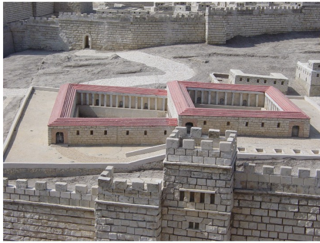
Modell von Bethesda