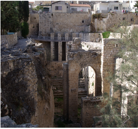
Ausgrabungen von Bethesda