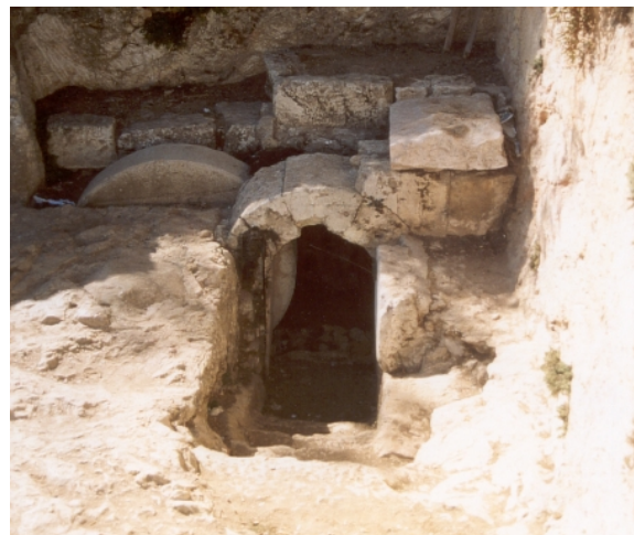
Grabanlage in Jerusalem aus der Zeit Jesu

Jesus wurde in solch eine Grabanlage gelegt. Diese Grabanlage war in der Nähe der Hinrichtungsstätte Golgatha, (damals noch) außerhalb der Stadtmauern Jerusalems.