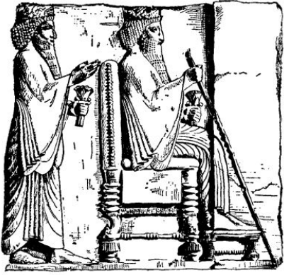
Darius aus Medien