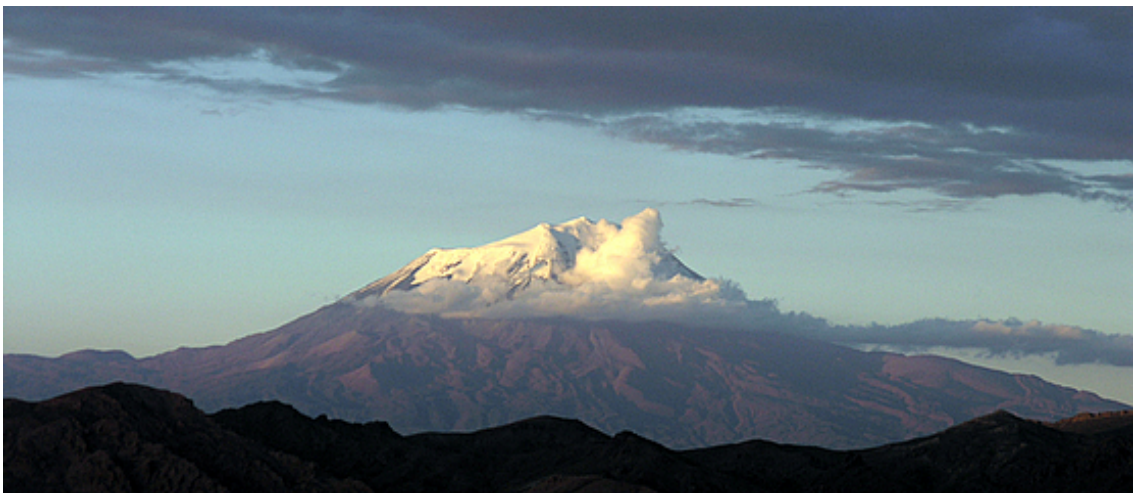
Das Gebirge Ararat, heutige Türkei

Und doch wartet Gott noch fast zwei geschlagene Monate, bis er Noah den Auftrag zum Aussteigen gab. – Über ein Jahr war nun vergangen.